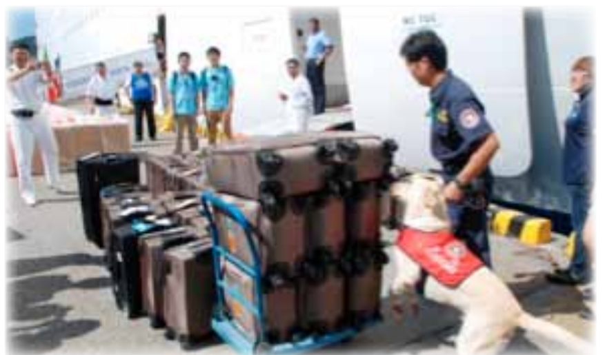
圖3 海關緝毒犬基隆港邊執行旅客行李毒品嗅聞任務

另外102年1月1日起菸酒管理法第46條修正後，入境旅客攜帶超量未申報菸酒，分別依每條捲菸、每磅菸絲、每25支雪茄或每公升酒，處500元以上、5,000元以下罰鍰，此一改革，亦須採取妥適對策，以避免等候辦理沒入及裁罰手續旅客於入境檢查檯大排長龍，使良法美意得以落實及獲得支持，有效維護臺灣之國際形象。