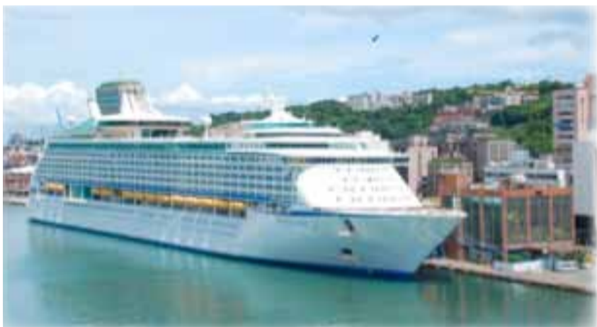
圖2 海洋航行者號靠泊基隆港東岸(中間為海洋航行者號、右側紅磚玻璃帷幕建築為基港大樓)