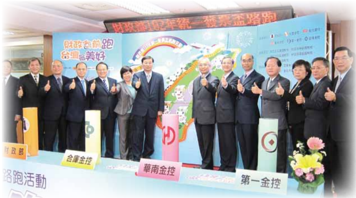
102年統一發票盃路跑活動時間及地點

次長特別感謝兆豐金控、彰化銀行、華南金控、第一金控及合庫金控在人力及物力上的協助，才能讓整個路跑活動更加順利，讓愛心傳播更廣，同時再次代表財政部感謝與會媒體記者及相關縣市政府在辦理活動期間的相關協助與幫忙，並預祝5場路跑活動順利成功。