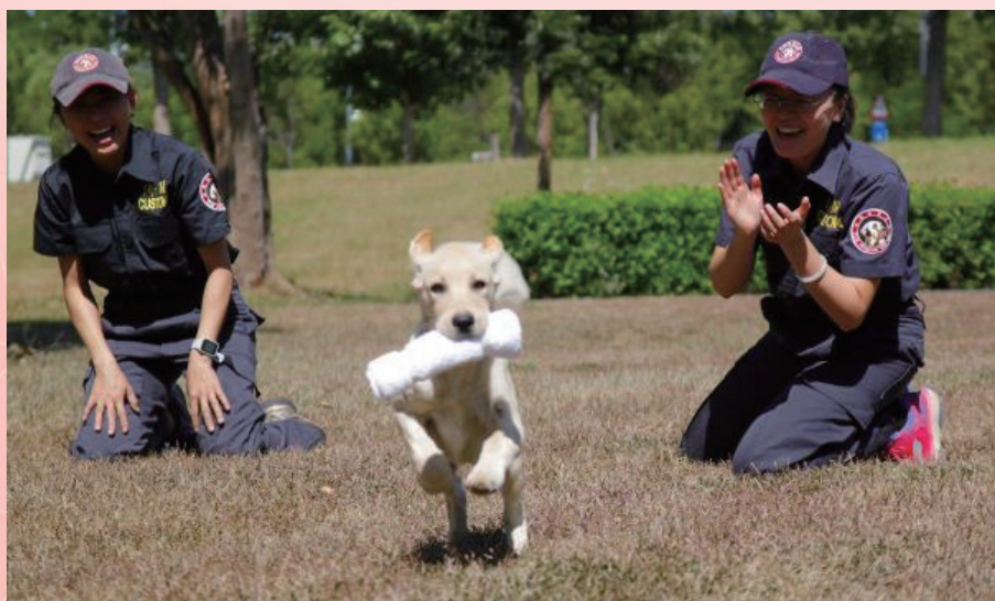
圖 4 關務署緝毒犬培訓中心培育發展中的拉布拉多幼犬