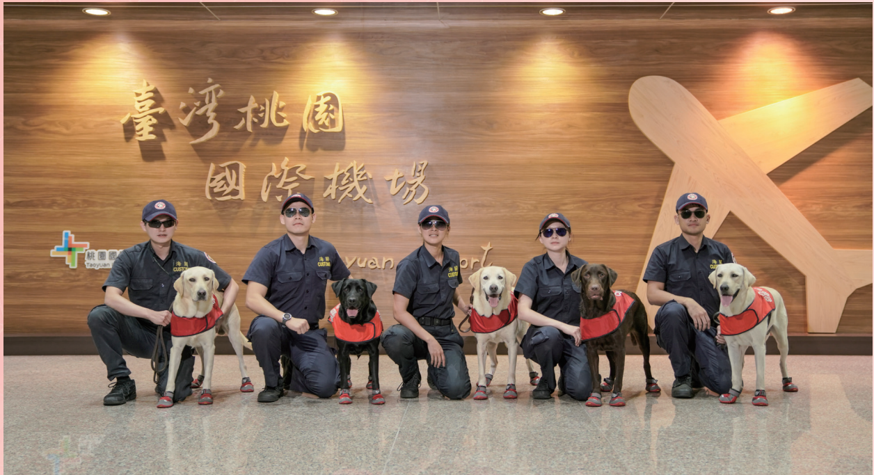
圖 5 部署於國門的海關緝毒犬隊