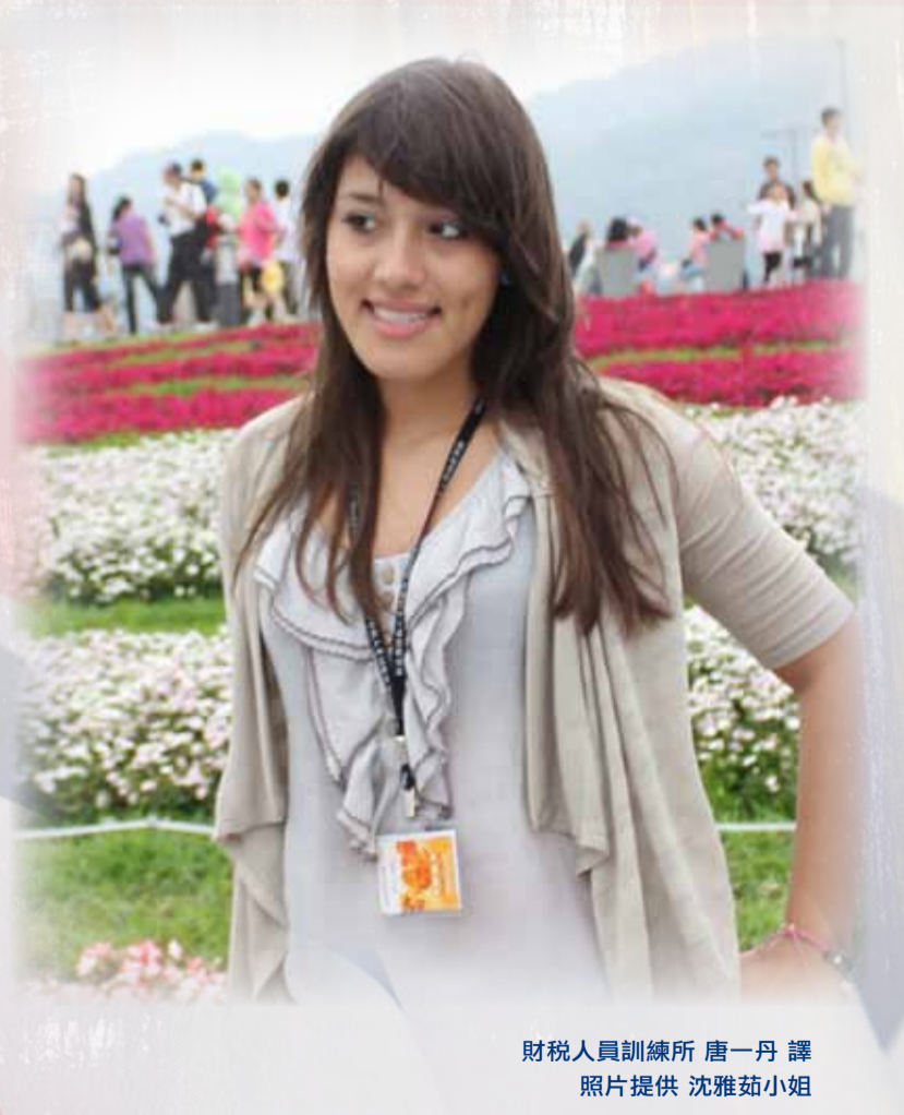
財稅人員訓練所 唐一丹 譯

我必須說我在臺灣學到的每一件事，深深的說服（影響）了我，我永遠不會忘記在臺灣美好的經歷。感謝財訓所所有的員工，他們隨時都是如此的樂於助人，另外，特別要感謝輔導員們無論在財訓所內，或者在財訓所外，因為有你們，我才能如此安心自在。