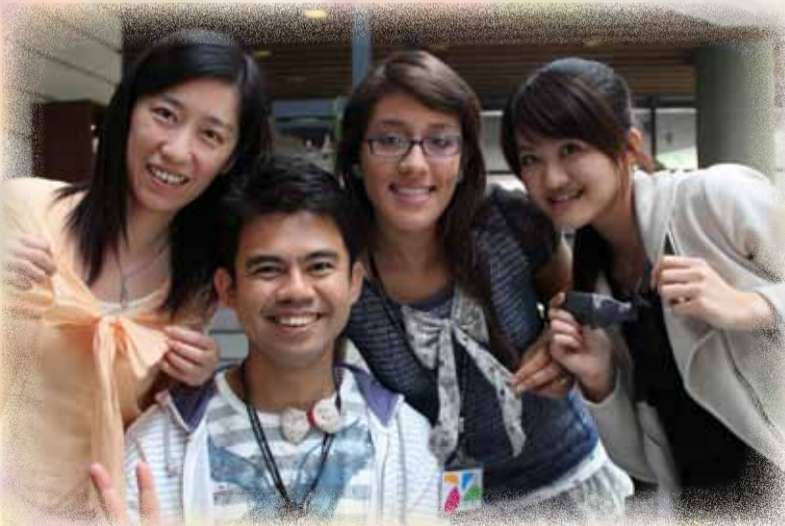
財稅人員訓練所 唐一丹 譯