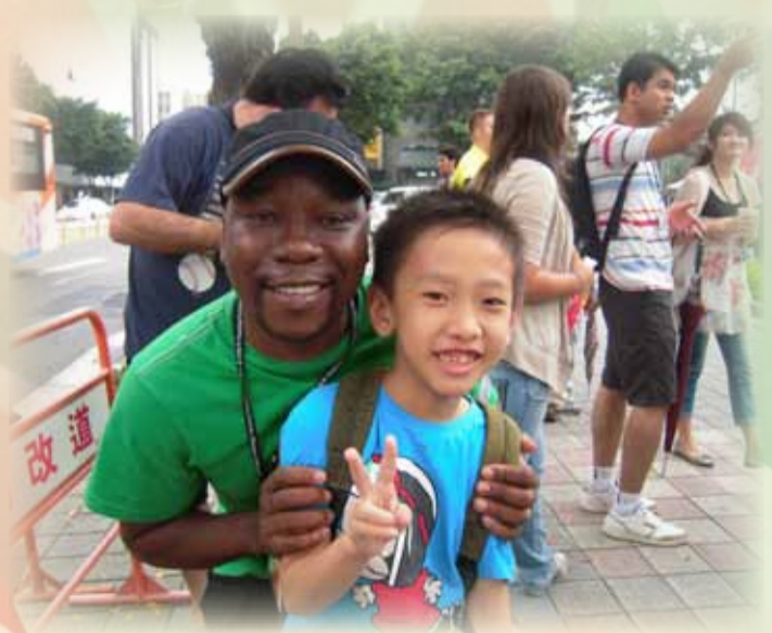
財稅人員訓練所 唐一丹 譯