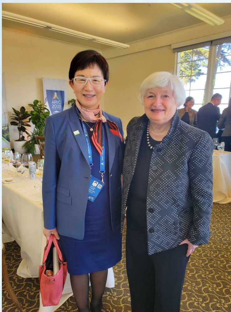
財長閉門會議後莊部長與美國財政部長葉倫合影

我國代表團於會議中與 APEC 經濟體、國際組織及私部門分享我國經驗，提高國際參與，強化公私夥伴合作關係，成果豐碩。