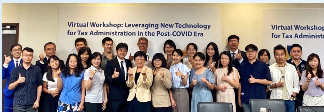
財政部李慶華政務次長與視訊工作坊工作人員合照

透過這次難得機會，我國與 APEC 經濟體及國際組織深入交流，探討稅務行政數位轉型相關政策與經驗，協助與會經濟體能力建構，促進 APEC 區域共同邁向包容及永續發展。亦透過此次與 APEC 合作機會，共同推廣性別平等，鼓勵女性參與數位科技發展及應用相關領域。期望未來我國持續深化國際參與，致力推動我國與國際組織及其他經濟體間財稅政策交流與合作。