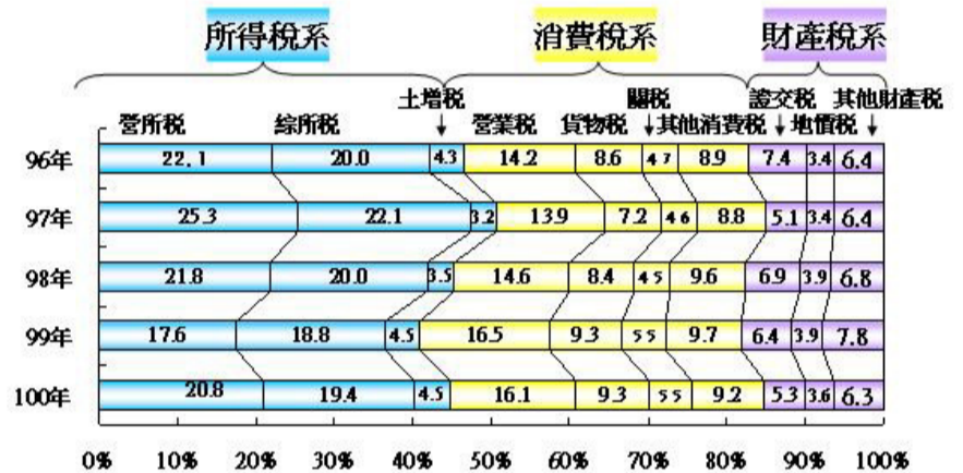
圖二、國內依三大稅系別結構分析