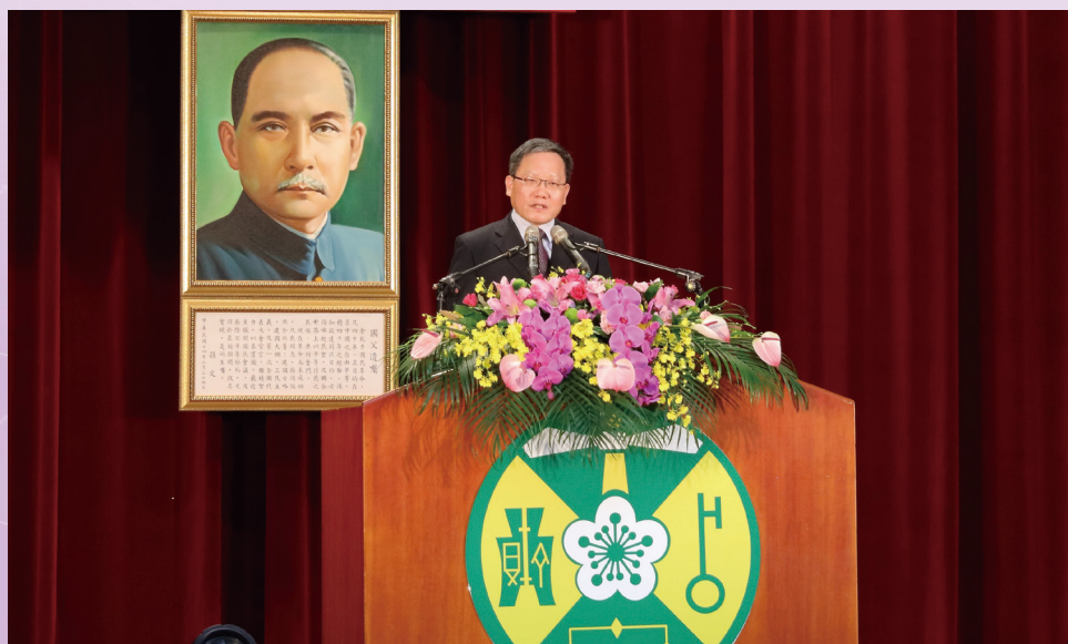
財政部蘇部長致詞