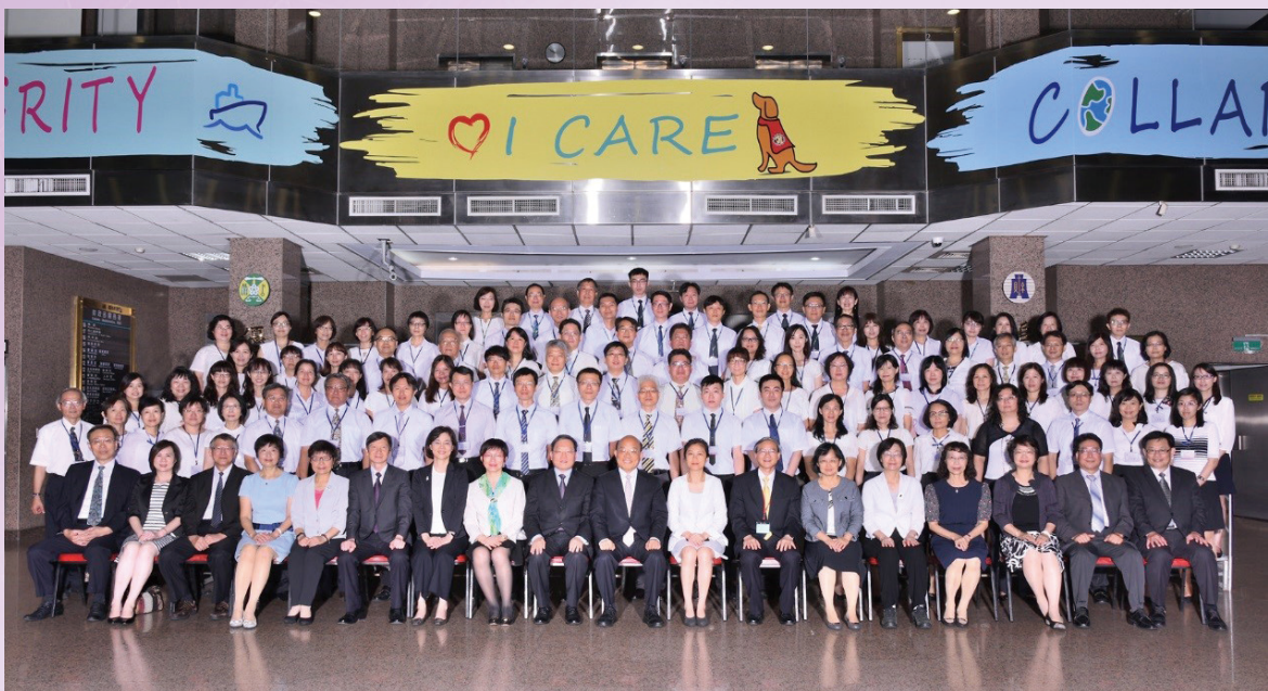
稅務節慶祝暨表揚大會合影留念

未來，財政部在稅務及關務方面，一定會秉持著院長所提到的，簡政輕稅、友善投資及防守邊境這3個原則，做好國家財政及稅關務的目的，最後，祝福今天獲得榮譽的各位，這是一生的榮耀，謝謝院長及 Kolas 發言人能夠出席今天的頒獎典禮與稅務節慶祝活動，給我們莫大的鼓舞，謝謝大家。