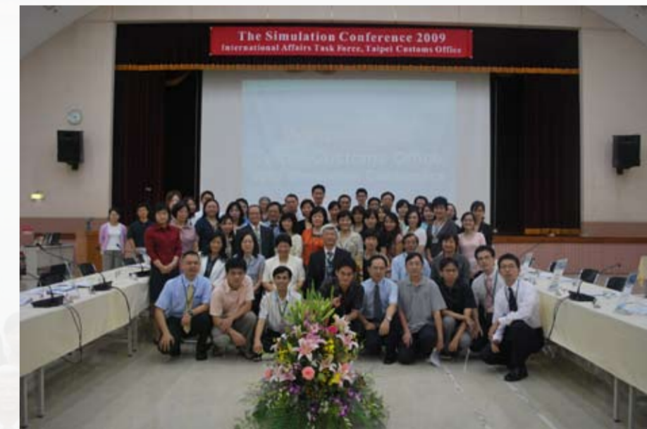
國際事務小組於本（98）年6月17日舉辦模擬國際會議

I sincerely appreciate our members who give up precious time after work and are willing to challenge themselves, which in turn foster self-confidence and personal growth. We also hope that they will continue to provide the high-quality service and to fully display the function of International Affairs Task force in Taipei Customs.