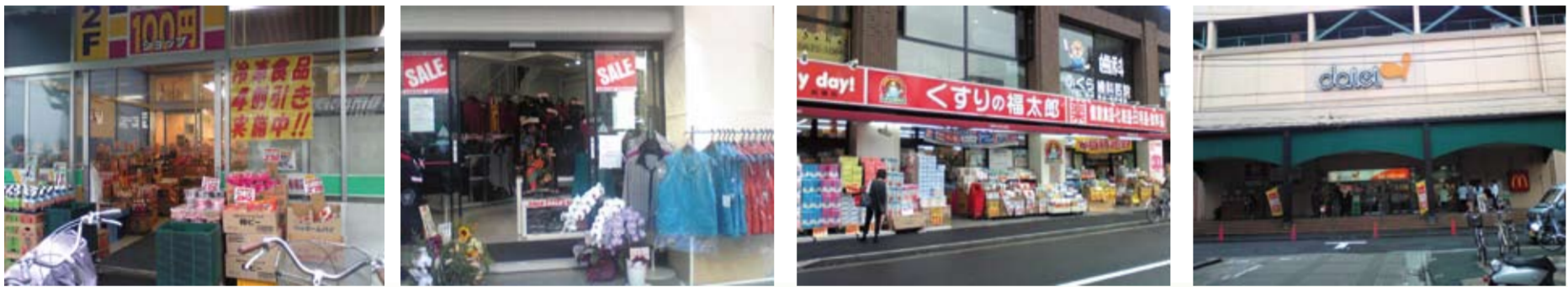
景氣蕭條的日本街景

二〇〇九年八月，日本進行國會改選，如何提昇現今低迷之景氣，減緩現在之高失業率，減少每年高達三萬人以上之自殺者，也成為選前朝野政黨之主要訴求。二〇〇九年九月份起，日本進行了首次的政黨輪替，由以往在野的民主黨開始執政。儘管日本民眾對政權更換有著高度期待，政黨輪替後亦有一番新的景象，但目前低迷的景氣何時才能復甦？居高不下的失業率何時才能下降？因經濟因素所導致的高自殺率何時才能減緩？或許仍有待努力而難以推論。