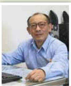
財政部關務署 臺北關／葉元中

從事公職近 20 年，林審核員在總局服務的時間較長，較常處理分局稽徵所提出實務面臨之問題，偶爾也會遇到爭執較久的陳情人，她認為無論面對同仁或民眾，以「將心比心」的同理角度為他人設想，就會要求自己不只是把事情做好，還要做得更好，換言之，以「同理心」為出發點，充分瞭解問題及需求，才能妥善運用專業，圓滿處置公務。