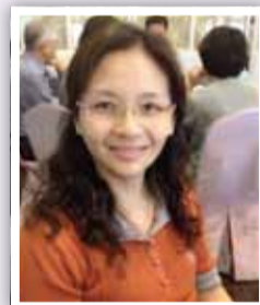
財政部國有財產署 南區分署／陳茵茵

對於先前遭到不明人士攻擊的事件，葉股長表示，當天驗完傷即回工作崗位，不能讓有心人士以為他畏於暴力，或誤認海關公權力退縮。他認為最近雖有少數人行為逾矩，造成海關整體形象蒙受傷害，期望藉由自己的例子，讓外界知道事實上大多數的海關同仁，都與他一樣敬業認真與勤奮並且戮力從公。