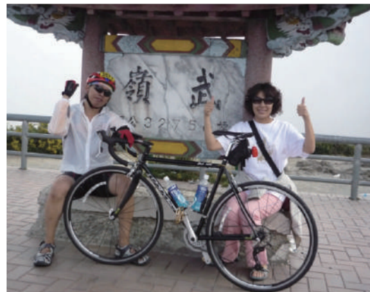
此次比賽前3名都在3小時內.....真是神人丫

從96年初開始騎單車運動後，2年來騎遍台南週邊，單日破百km已非難事，平日相互約騎的車友們也無法滿足於台南附近的路線，在這些壞朋友相互刺激下，今年開始報名參加單車賽事。我選擇的是幾近全為爬坡路線的賽事，一方面是挑戰自我、親近山林美景；一方面是小時因騎車摔傷留下心裡陰影，當速度稍快一點，對大角度的左轉，就會有抓不準過彎點的感覺，只能提前煞慢速度因應，所以對路線起伏頻繁的賽事敬謝不敏，避免下坡過彎，速度過慢，被後方選手追撞。