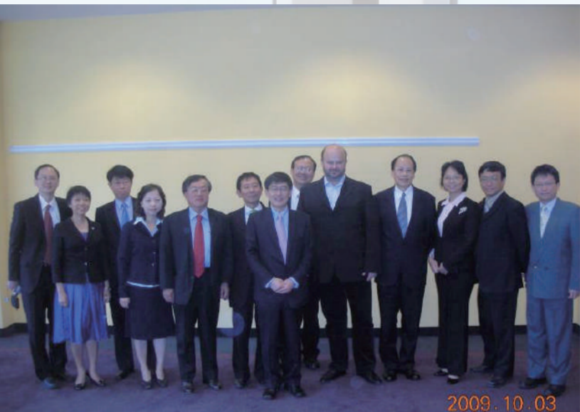
與捷克內政部部长於98年10月3日早餐會報後之合影

四、我國代表於本研討會中發表的主題分別為：(一) e-Government Status and Outlook in Taiwan、(二) Building e-Government Infrastructure and Services、(三) Integrating