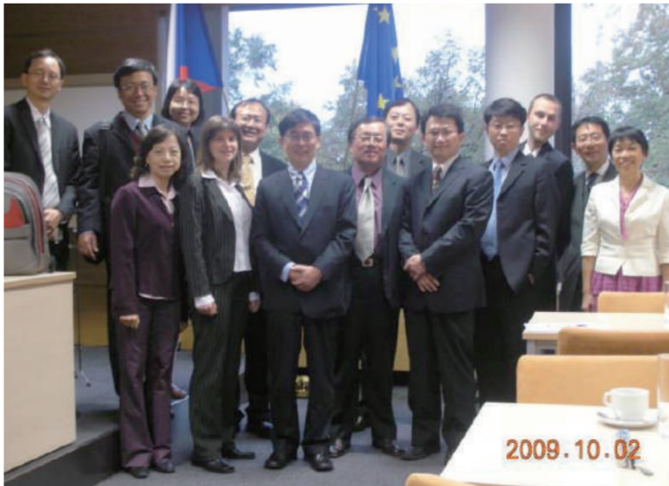
98年10月2日研討會當天出席狀況(上)：會後與部份捷克方代表合影(下)