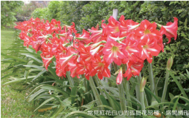
常見紅花白心的孤挺花品種，盛開情形