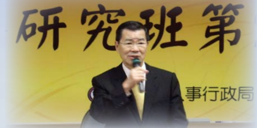
蕭副總統蒞臨結訓典禮致詞