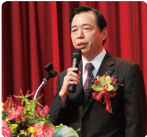
▲部長期勉大家，只要盡心別人看的見，用心就會展現在工作績效上，在任何時間事事用心時時關心，會讓社會更祥和。