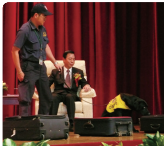
▲今年表揚大會特別安排海關緝毒犬秀，展示海關緝毒犬靈敏的嗅覺。

今天非常難得來表揚在座諸位過去辛辛苦苦盡心盡力的表現，只要盡心別人看得見，用心就會展現在工作績效上，在任何時間事事用心時時關心，會讓社會更祥和。雖然財政為庶政之母，但是如何省錢、找錢、賺錢的方法很多，政府是一體的，尤其更要跟民間互動，所以今天特別安排表揚記帳士及報稅代理人，如果政府與民間之互動能更溫馨和協，社會才能更祥和，我也希望員工素質、業務品質提升，讓機關氣質、形象及尊嚴能夠更提升，同仁們都能走路有風，再次感謝在座所有同仁的努力，盼大家一起努力讓我們明天會更好，謝謝大家！