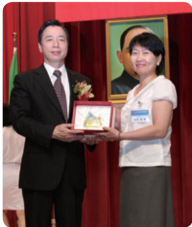
▲部長逐一與受獎人握手合照並頒發獎座。

今年的稅務節慶祝大會由關政司及關稅總局主辦，為讓各國駐台代表瞭解我國海關，加強與各國駐台代表互動交流，本部關政司及關稅總局亦特別合作舉辦海關嘉年華，邀請各國駐台代表處或辦事處之使節代表暨人員參觀關務成果展，並前往參訪基隆關稅局，深入瞭解我國關務進步情形，同時平日不開放的海關博物館，以及海關燈塔也配合選擇12座開放供民眾參觀。大會由李部長主持並逐一頒獎。