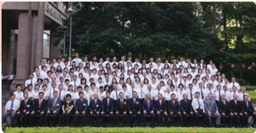
▲行政院邱副院長正雄親臨會場致詞，並與全體受獎人拍照留念。

部長勗勉全體稅關務同仁推動三質管理，提升同仁素質、業務品質及機關氣質，讓我們的明天更好。