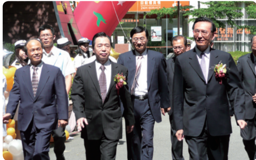
▲部長期許同仁提升素質、業務品質及機關氣質，靠績效、服務態度和品質來贏得形象及尊嚴，走路就會有風。

力之下，我們一直在成長及精進，在齊聚慶祝稅務節之同時也要檢討過去及策勵未來，今天除在座所有經審核的優秀稅關務同仁及資深同仁之外，更難能可貴地請記帳士、稅務代理人與我們一起來互動，這些互動將影響稅務行政的品