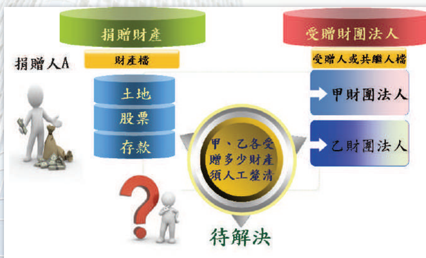
圖二：資料欠缺精確性-受贈財產無法明確區分

本局曾於 106 年 5 月間蒐集本轄較大財團法人受贈資料，進行輔導受贈財團法人辦理 105 年度結算申報計 5 件，受贈金額共計 14.8 億元，於蒐集資料的同時，發現現行建檔資料庫係分別以財產資料及受贈人資料為主軸建構「受贈人檔」與「財產檔」，受贈人檔的鍵值為「贈與人 IDN、受贈人 IDN/BAN、受贈人姓名及位址等」；當受贈對象有二個以上者必須逐一鍵入法人資料，「財產檔」的鍵入值為「贈與人 IDN、財產種類、贈與價額等」，無法逐一鍵入個別受贈財團法人資產明細資料，換言之，「受贈人檔」與「財產檔」並不存在「連結關係」，以致現行系統建置之核定資料欠缺精確性—無法明確區分個別財團法人受贈財產明細，必須調閱紙本申報資料及審查報告才能了解受贈明細；及完整性—跨轄區資料，無法由建檔系統取得明細檔案，而必須仰賴可能產生通報疏漏之人工作業，徒耗人力與效益。（詳圖二）